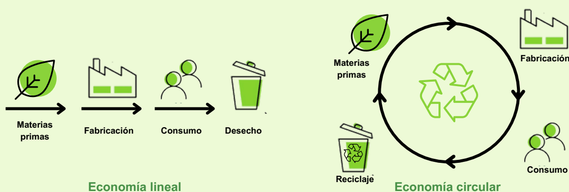
Esquema 1. Diferencias Economía Lineal y Economía Circular.

En este sentido, el Modelo de Economía Circular supone una herramienta para la incorporación de la sostenibilidad a los procesos productivos. La Fundación Ellen MacArthur define la circularidad como un marco de soluciones sistémicas que hace frente a desafíos globales, a través de los siguientes principios: eliminar los residuos y la contaminación, circular los productos y materiales (en su valor más alto), regenerar la naturaleza. En otras palabras, el modelo circular propone el uso de los recursos aprovechando su máximo valor posible y durante el mayor tiempo posible, eliminando los residuos desde el diseño de los productos e incorporando medidas para la regeneración de la naturaleza.